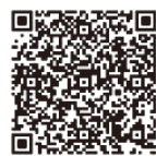
↑ Google Play