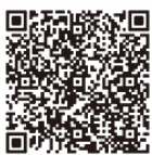
↑ App Store